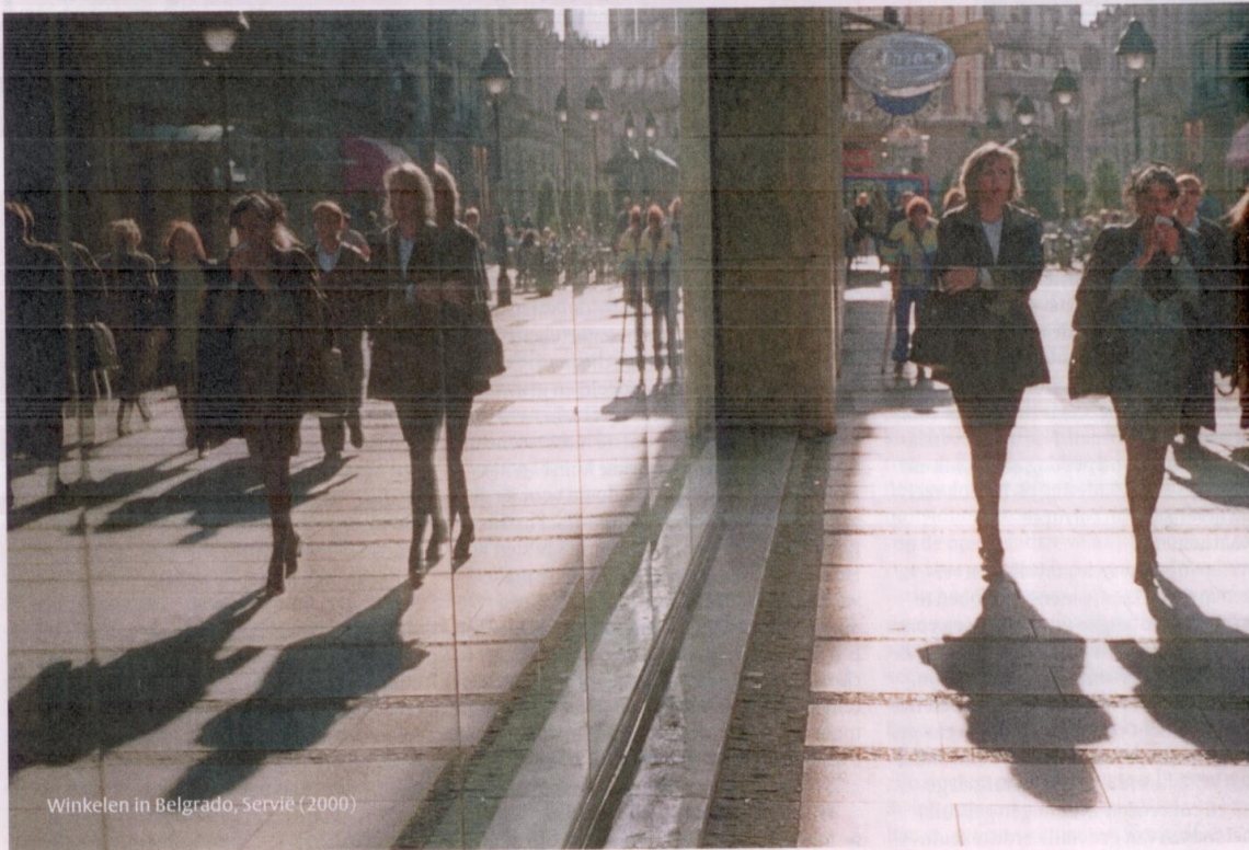
Winkelen in Belgrado, Servië (2000)