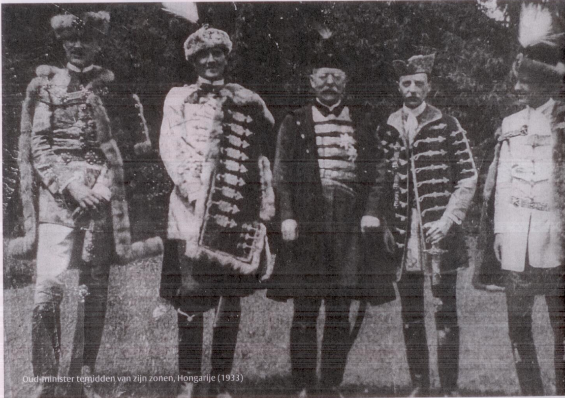
Oud-minister temidden van zijn zonen, Hongarije (1933)