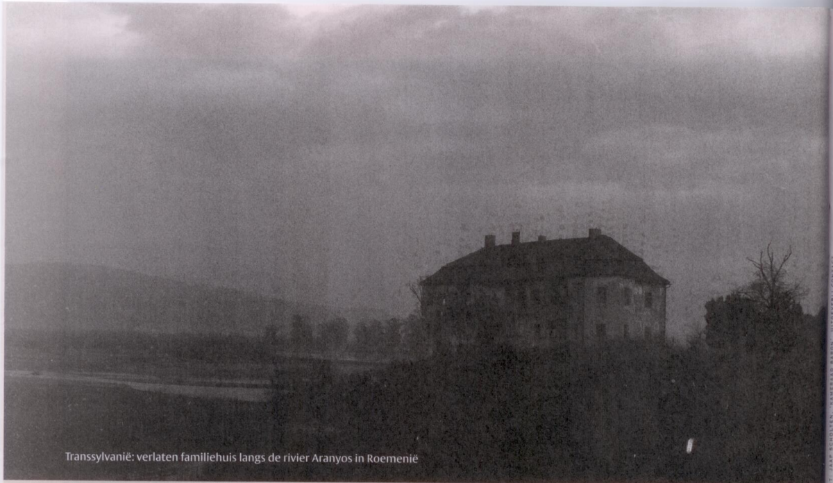
Transsylvanië: verlaten familiehuus langs de rivier Aranyos in Roemenië