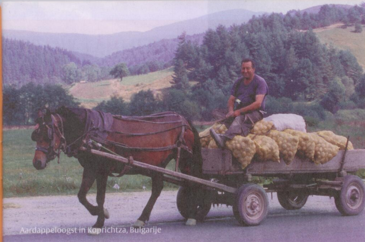
Aardappeloogst in Koprchtza, Bulgarije

geweldige basis voor waardigheid. Waartegen moeten ze nu vechten? Het is zogenaamd een democratie, maar in werkelijkheid is het een kleptocratie. De vijand is onzichtbaar geworden.'